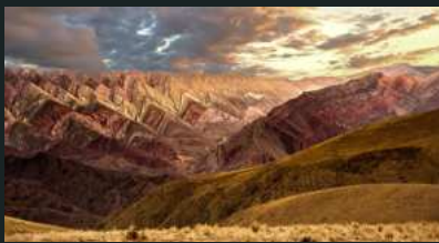
Quebrada de Humahuaca

In Patagonien ist einer der wenigen Gletscher weltweit, der noch wächst. Seine majestätischen blauen Eiswände ziehen Besucher aus der ganzen Welt an.