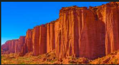
Parque Nacional Talampaya

Im Norden Argentinien ist bekannt für ihre bunten Berge und ihre reiche indigene Geschichte. Sie ist ein UNESCO-Weltkulturerbe.