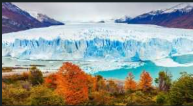
Glaciar Perito Moreno

Zwischen Argentinien und Brasilien gelegen, befindet sich einer der beeindruckendsten Wasserfälle der Welt. Mit mehr als 270 Wasserfällen bieten sie ein unvergleichliches Naturschauspiel.