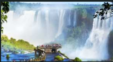
Cataratas del Iguazú

Ubicadas entre Argentina y Brasil, son una de las más impresionantes del mundo. Con más de 270 saltos de agua, ofrecen un espectáculo natural incomparable.